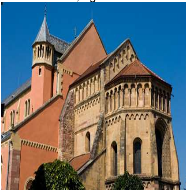
Pfaffenheim, église Saint-Martin