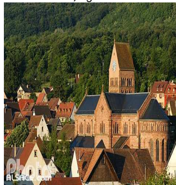
Guebwiller, église Saint-Pantaléon